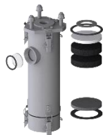
Beispielhafte Darstellung des Ersatzteilsets